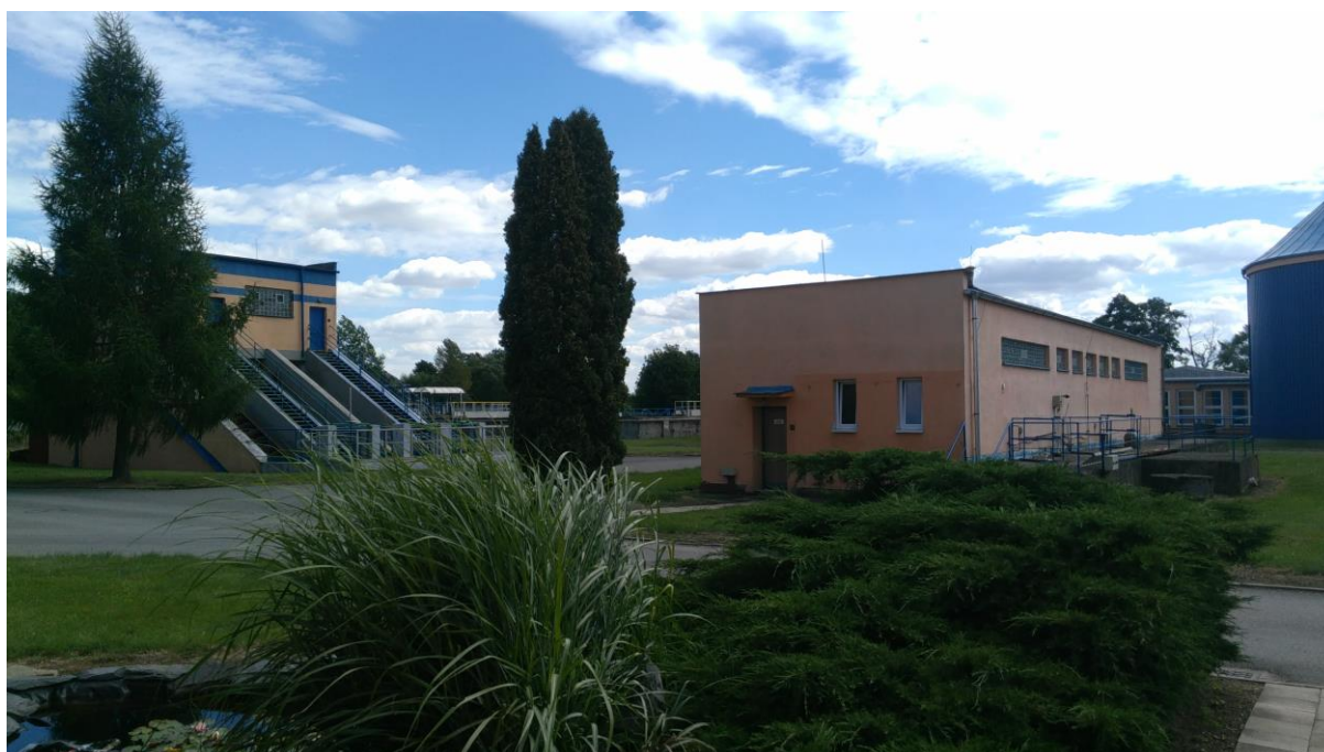
Areál společnosti Krnovské vodovody a kanalizace, s. r. o.