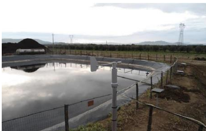
„Korouhev” – indikátor směru větru