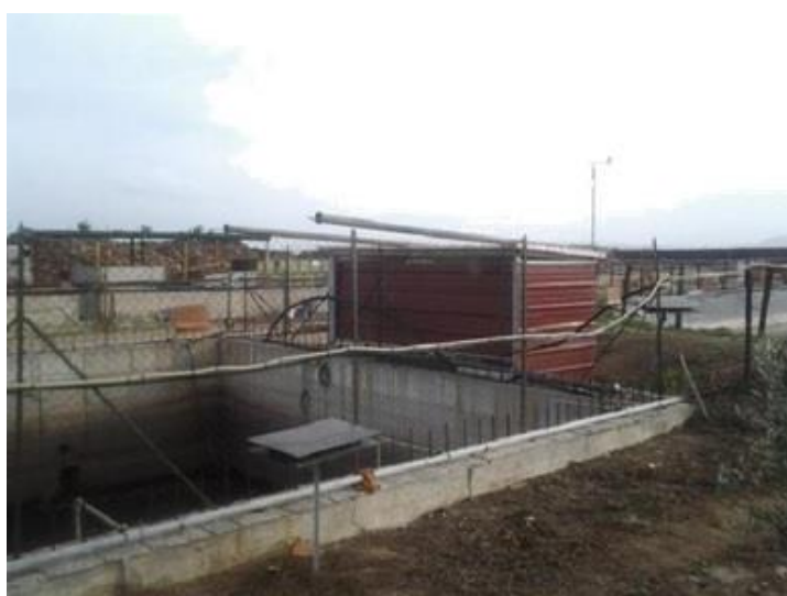
Neutralizace zápachu malé laguny