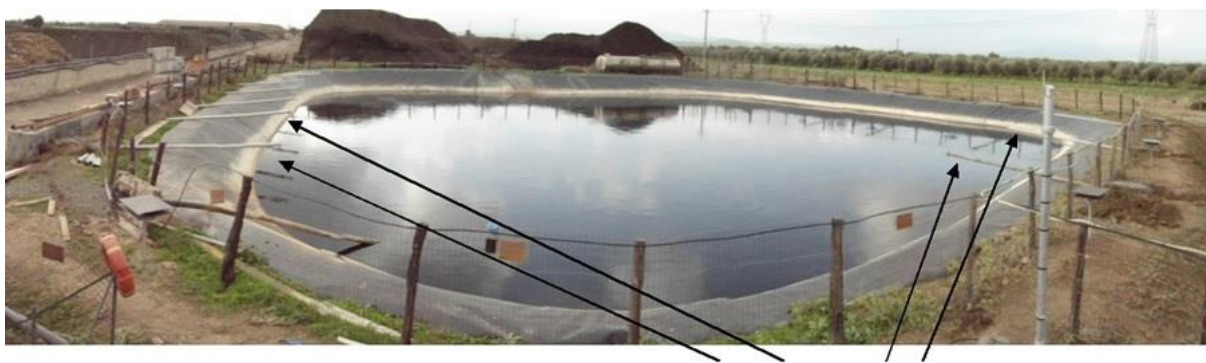
Neutralizace zápachu velké laguny - trubice zakončené tryskami