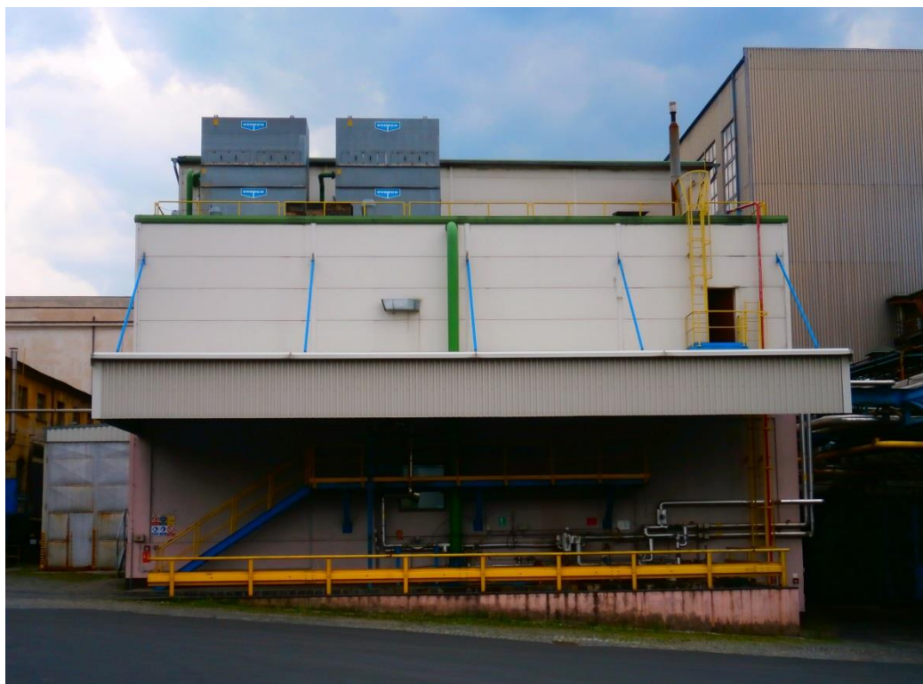
Budova nové glycerinky