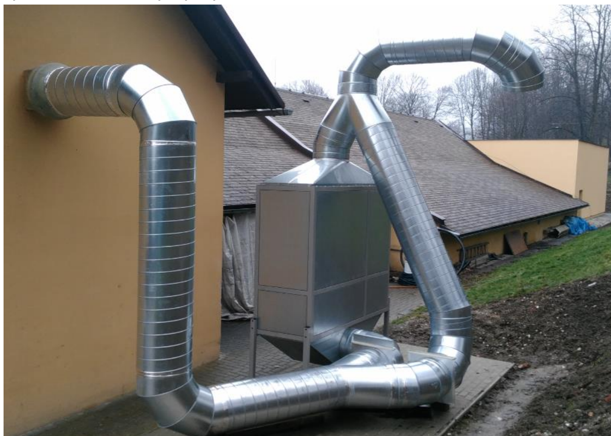
Vyústění vzduchotechniky z výroby