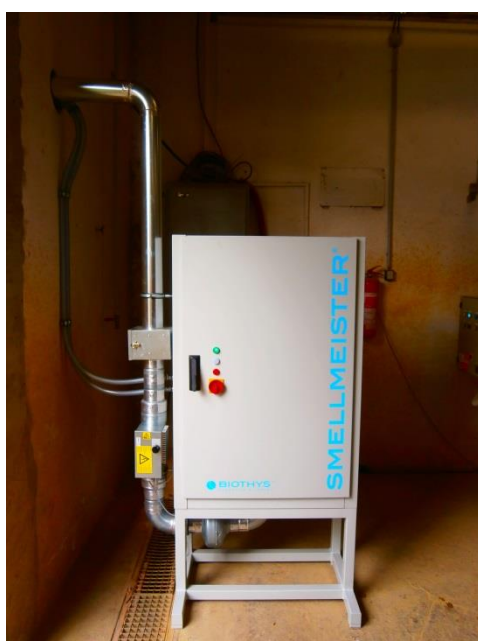
Smellmeister ® G36